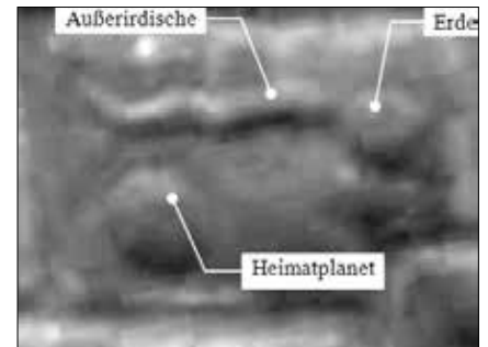
Abb. 2 und 3: Ausschnitte aus Abb. 1.