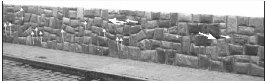
Abb. 1: Die beiden dickeren Pfeile zeigen auf die beiden Schlangensteine.