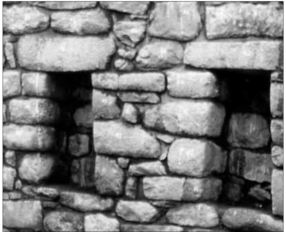
Abb. 5 und 6: Die berühmten typischen trapezförmigen „Fenster­nischen“.

Wie kam es nun zu diesen ungewöhnlichen Fenstern und Türen? Die Lösung war äußerst überraschend. Ein „Hofbeamter“ des Inka hatte von Kindheit an die Gabe, Naturgeister zu sehen. Eines Tages sagten ihm die Bergschatzen, man solle